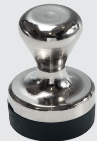
GM 14 S.56