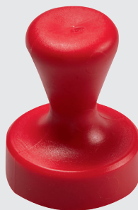
GM 13 S.02