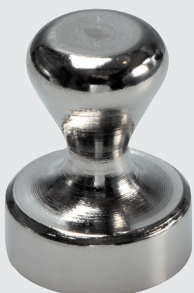
GM 12 S.56